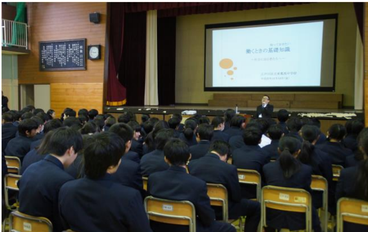
江戸川区立東葛西中学校での出前授業の様子(平成27年度)